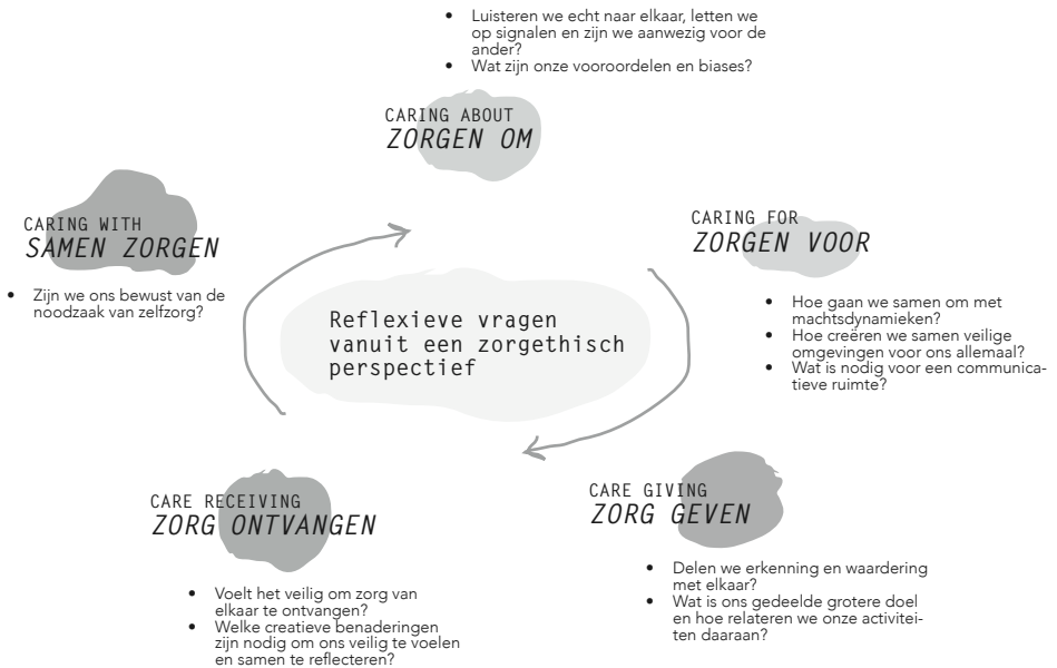
Figuur 3. Model van reflectievragen vanuit een zorg ethisch perspectief, vertaald uit Groot et al. (2018).

Ten slotte kunnen theoretische modellen en inzichten ondersteunend zijn voor onderzoeksteams. Zo kan bijvoorbeeld zorgethiek helpen bij het begrijpen van relationele complexiteit van participatief onderzoek. In mijn onderzoeken hielp de zorgethiek mij om bewust te zijn van mijn verantwoordelijkheden, maar ook van de verantwoordelijkheden van burgers en andere betrokkenen in een onderzoekssamenwerking. Zo hielp het werk van Joan Tronto (1993) (zorgen om, zorgen voor, zorg geven, zorg ontvangen, zorgen met) mij bij het ontrafelen van morele dilemma's (Groot et al., 2018), zie figuur 3. Ook bracht het werk van Tula Brannelly (2018) en Marian Barnes (Brannelly & Barnes, 2022) mij het bewustzijn dat participatief onderzoek an sich een vorm is van 'zorgen'. Ze noemen participatief onderzoek dan ook 'zorgzaam onderzoek'. Verder bracht het werk van Sarah Banks (2013) vanuit sociaal werk mij hulp bij reflectie. Wij vertaalden haar werk rondom ethiekwerk naar participatief onderzoek (Groot & Abma, 2022),