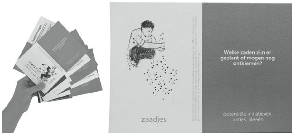
Figuur 1. Kaartenset 'Samenwerken als een Bos': www.agefriendlycommunity.org .